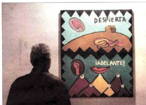
CON POESÍA. Un visitante frente a una de las pinturas de la muestra.

Cada artista del grupo participante ha escogido un poema de Miguel Hernández como motivo de su obra, la cual se expondrá